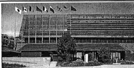
※2008年7月北海道洞爺湖サミット国際メディアセンター前で撮影。積水ハウス関東工場のゼロエミッションセンターに移設されました。同時に経済産業省指定の「茨城県 次世代エネルギーパーク」として一般公開されています。

本大会を開催するに当たり、全国から訪れる人々を温かく迎え、また選手が安心してプレーが出来るよう、市内各地区から応援担当サポーターの協力をいただき、チームや保護者とのさまざまな交流を図りました。応援サポーターがチームの実情を知って、回を重ねるごとに適切なサポートができるようになってきたように感じました。加えて、市内小学生で構成する「ふるさとのびのびクラブ」の作品発表もあり、氷見市の魅力を全国に発信しようとした当初の目的は達成できました。