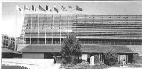
※2008年7月北海道利根川ルーツ村 国際メディアセンター前で撮影。積水ハウス関東工場のゼロエミッションセンターに移送されました。同時に経済産業省指定の【茨城県 次世代エネルギーパーク】として一般公開されています。