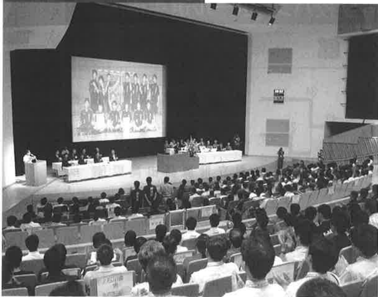
開会式会場の浦添市てだこホール