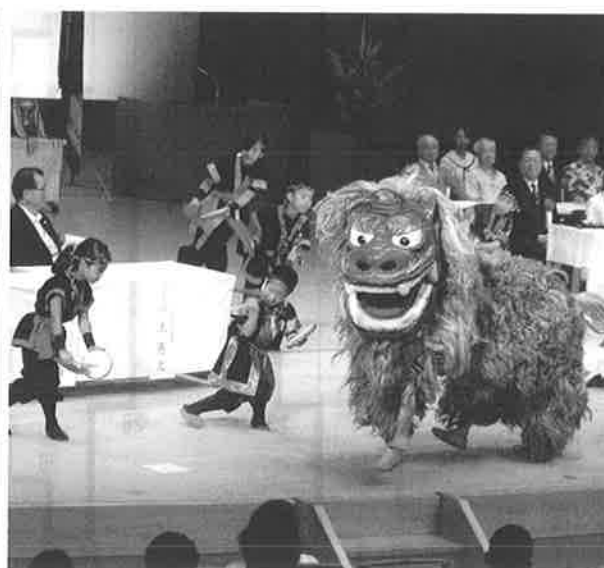
歓迎アトラクション 琉球太鼓、創作舞踊（浦添市在中の小中高生による競演）