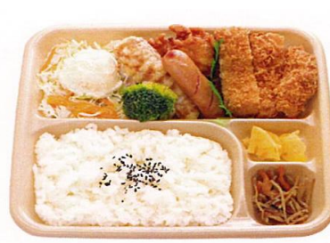
【日替わり弁当（お茶付き）】